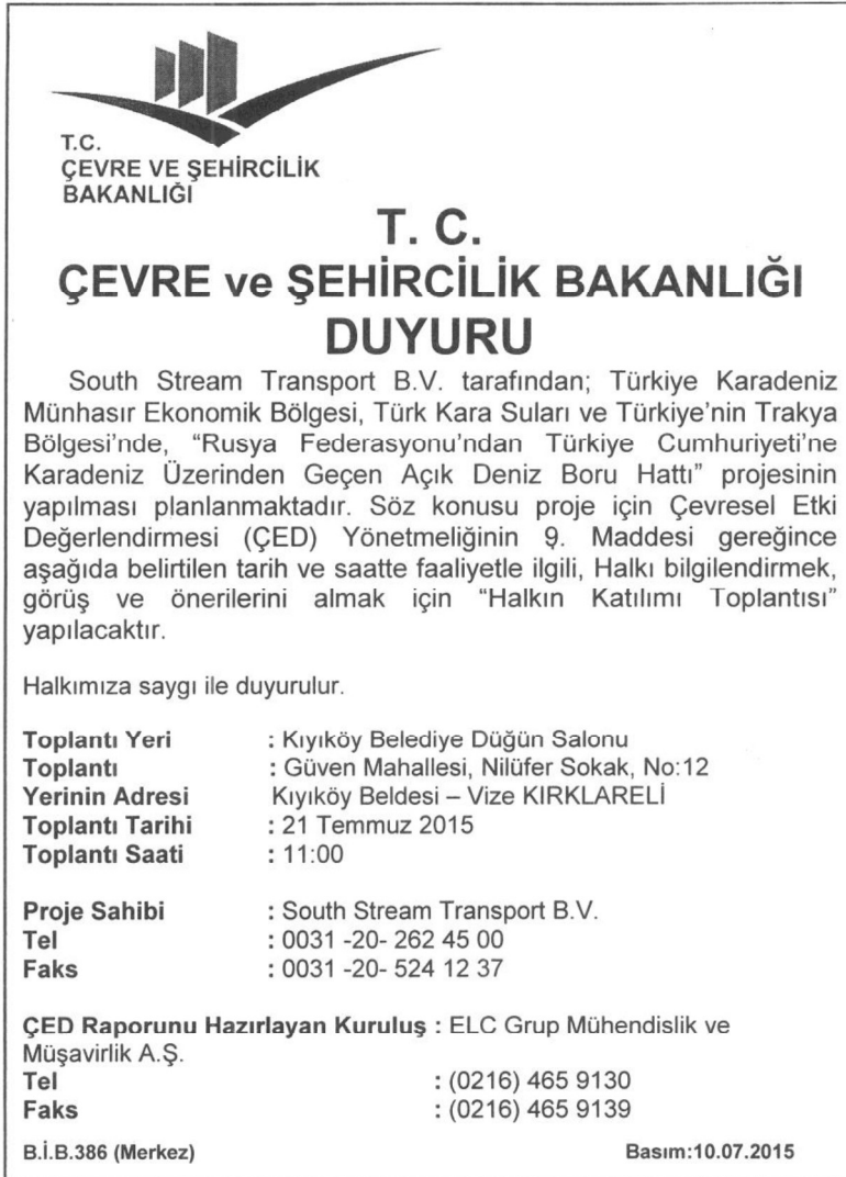
Şekil 5.1: Halkın Katılımı Toplantısı Gazete Duyurusu